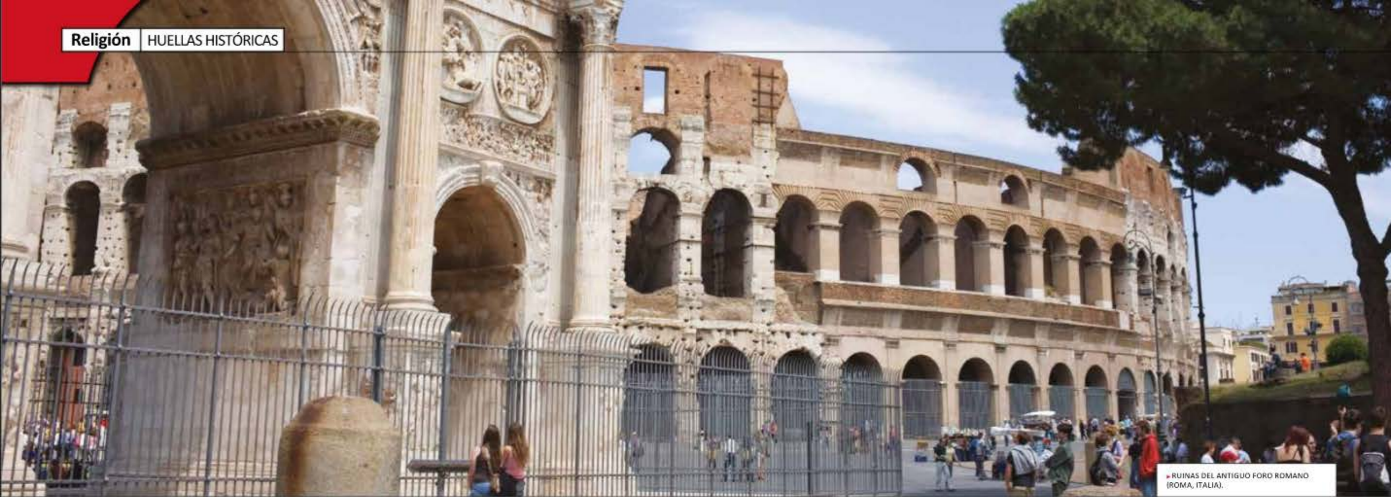
RUINAS DEL ANTIGUO FORO ROMANO (ROMA, ITALIA).