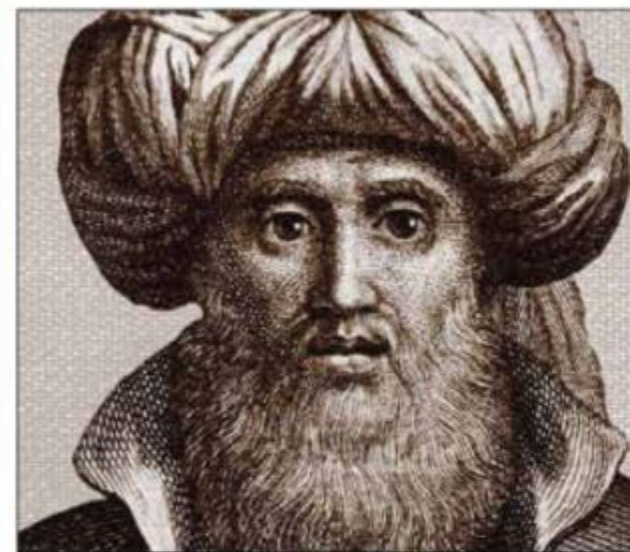
► POLÉMICA HISTÓRICA