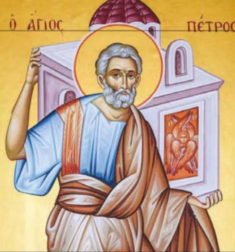
► EL EVANGELIO DE PEDRO ES UNO DE LOS TEXTOS HISTÓRICOS QUE PERMITEN SEGUIR LAS HUELLAS DEL PASADO DE LA FIGURA DE JESUCRISTO. ABAJO, RETRATO DEL HISTORIADOR FLAVIO JOSEFO.