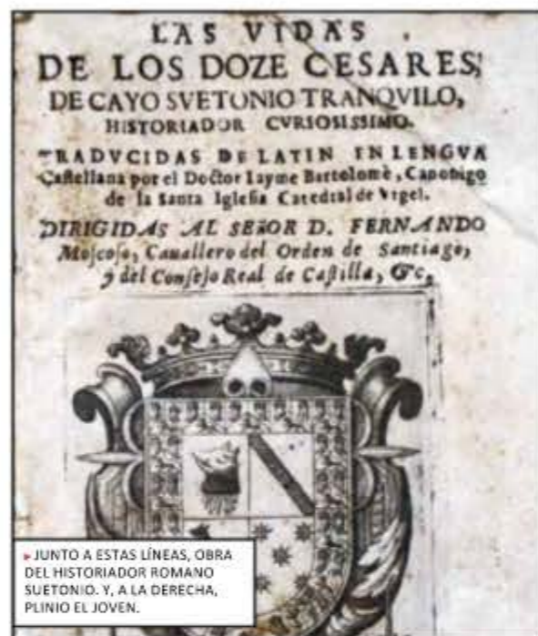
▶ JUNTO A ESTAS LÍNEAS, OBRA DEL HISTORIADOR ROMANO SVETONIO. Y, A LA DERECHA, PLINIO EL JOVEN.